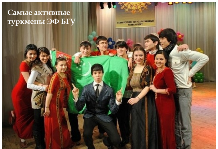
Самые активные туркмены ЭФ БГУ