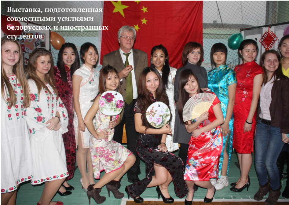
Выставка, подготовленная совместными усилиями белорусских и иностранных студентов

День дружбы народов – мероприятие, которое стало традиционным на экономическом факультете БГУ.