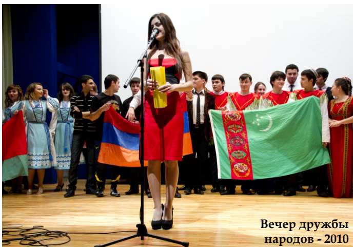
Вечер дружбы народов - 2010

Совместная подготовка высококвалифицированных специалистов – шаг в общее будущее.