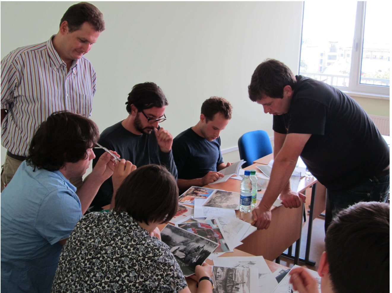
beim Unterricht – Geschichte und Baustile belarussischer Schlösser und Burgen