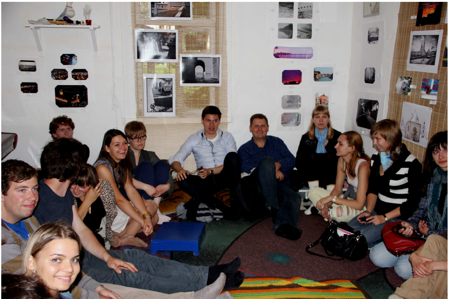
im Kulturhaus „La mora“ – Treffen mit dem Gegenwartsschriftsteller Sergej Kalenda