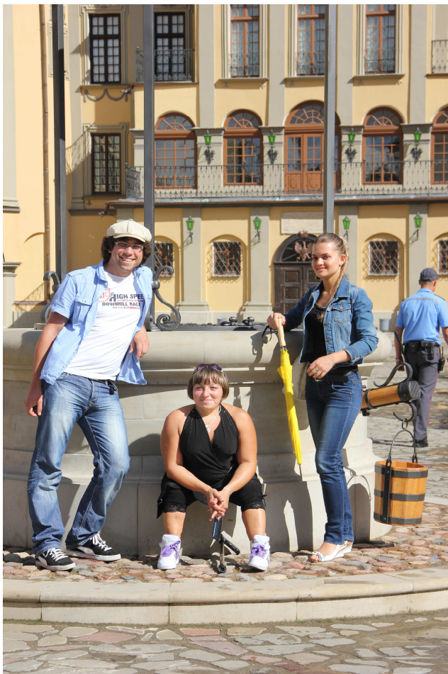
im Hof des Schlosses in Nesvizh