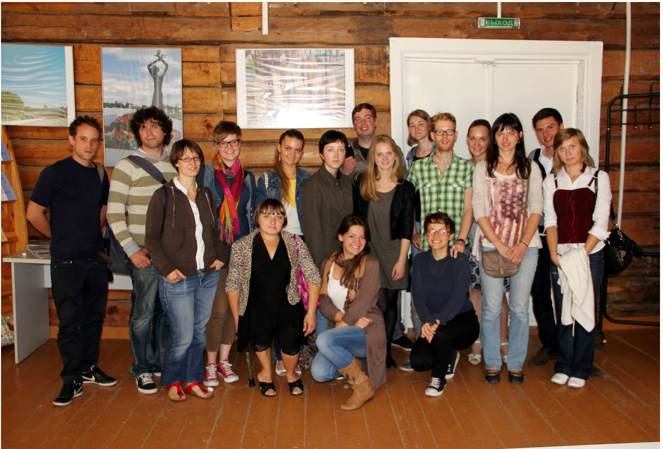
Besuch der Geschichtswerkstatt in Minsk