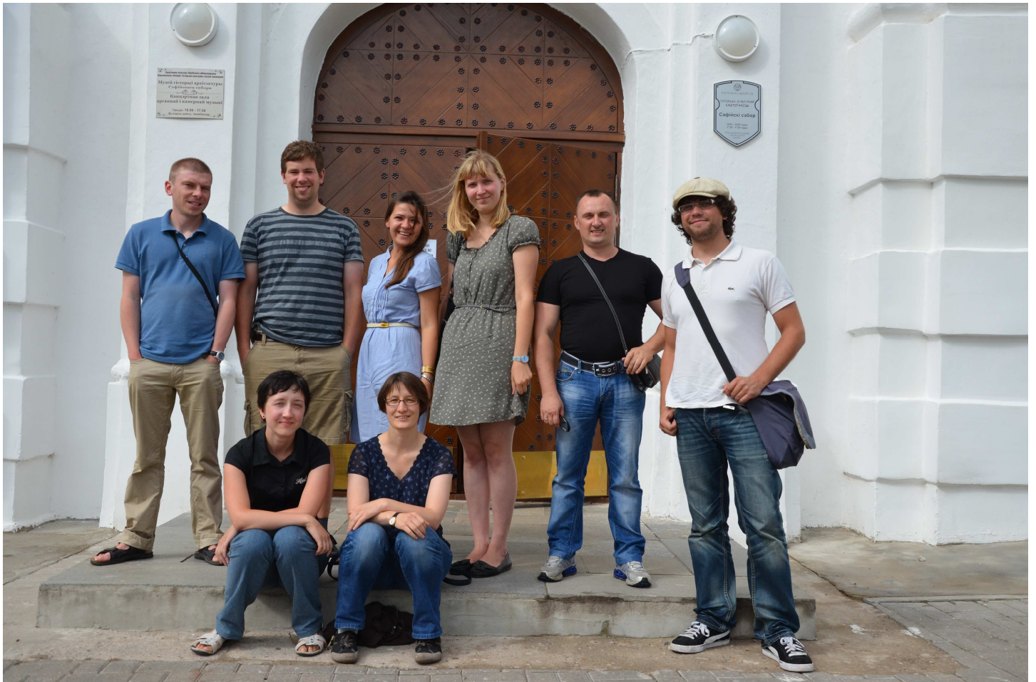
vor der Sophienkathedrale in Polozk