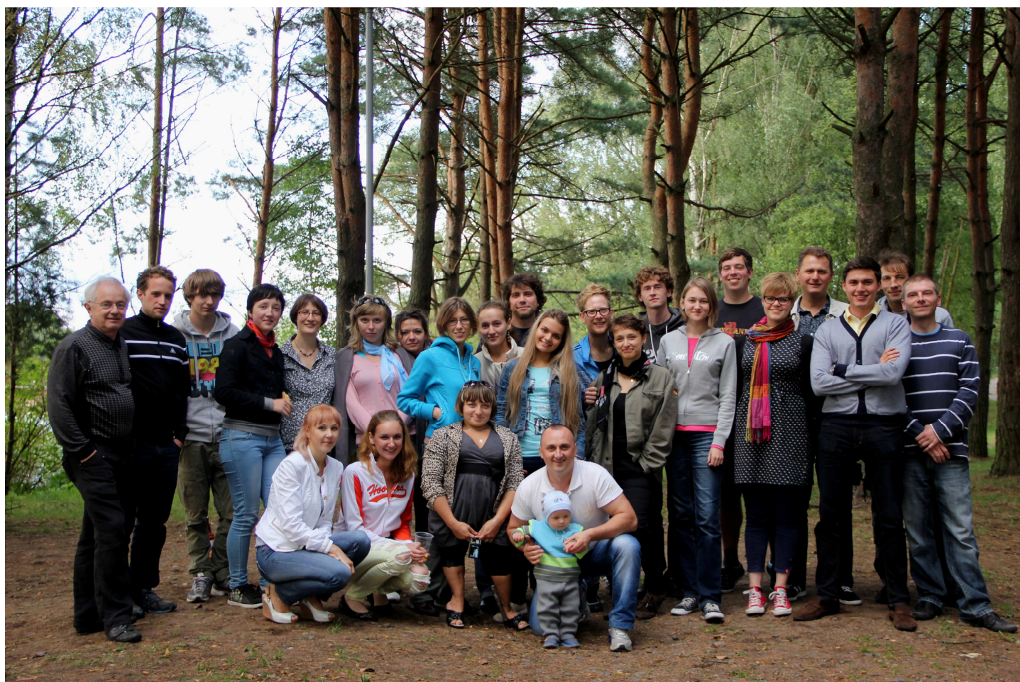
Abschlussabend am Minsker Meer