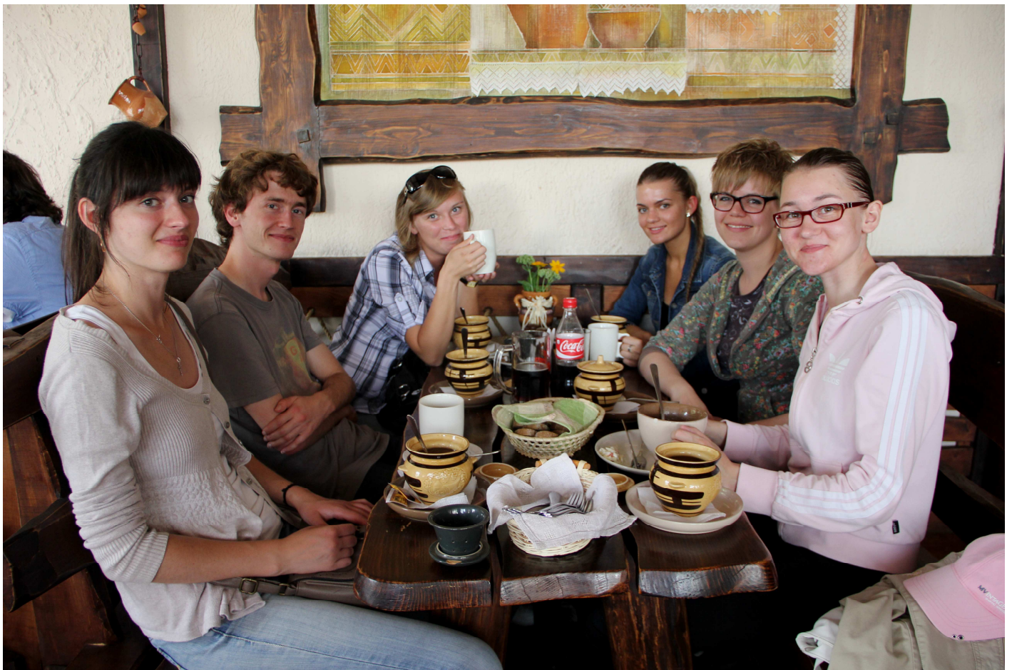
traditionelles belarussisches Mittagessen in Mir