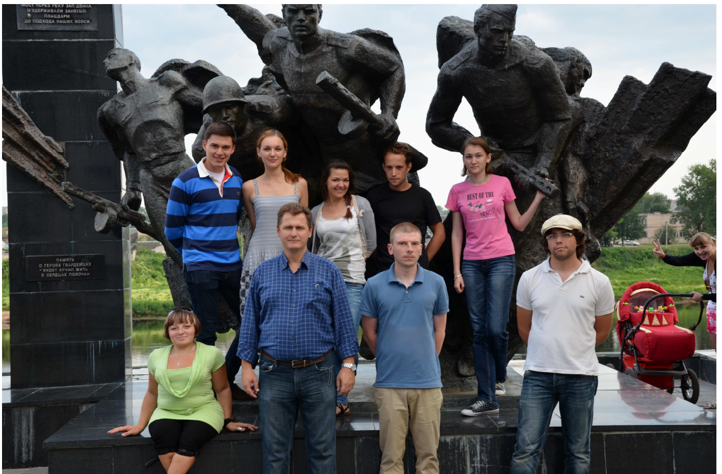
Kriegsdenkmal in Polozk