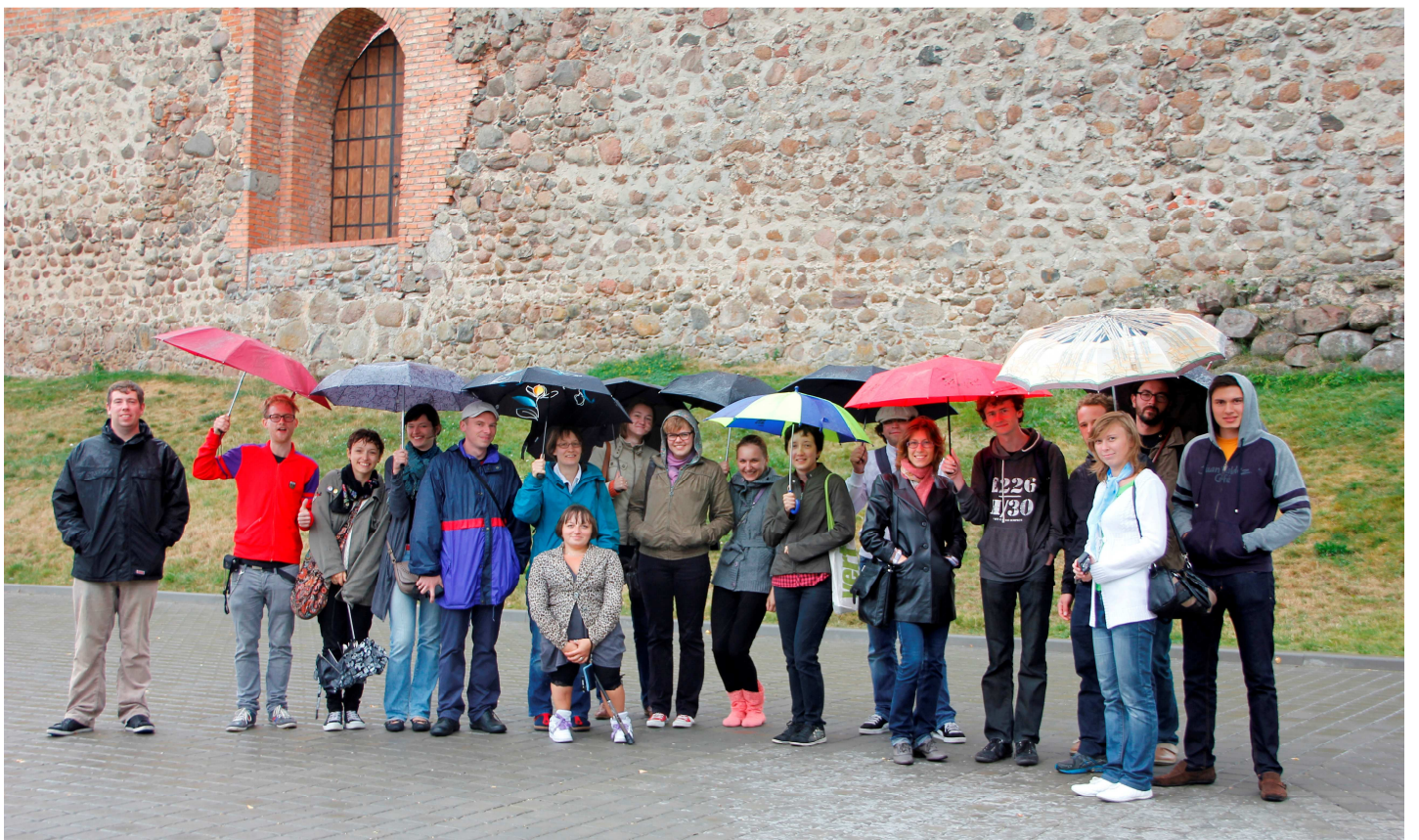
Besuch der Burg Lida – gute Laune trotz Regens