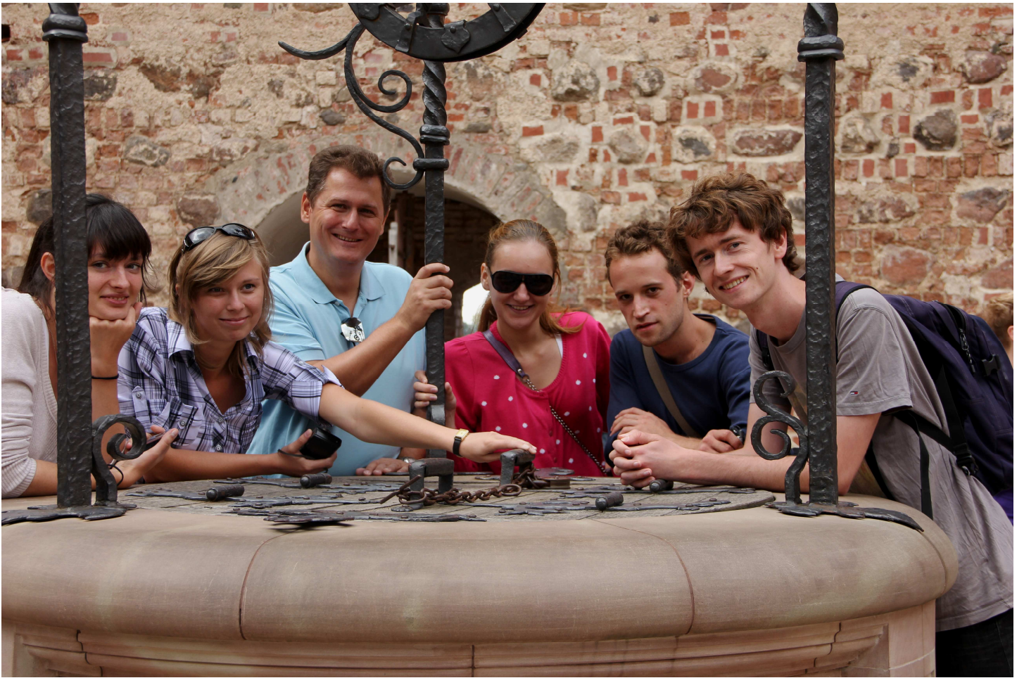
am Brunnen im Hof des Schlosses Mir