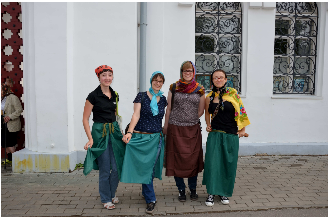
strenge Kleiderordnung beim Besuch des Klosters der Heiligen Euphrosyne von Polozk