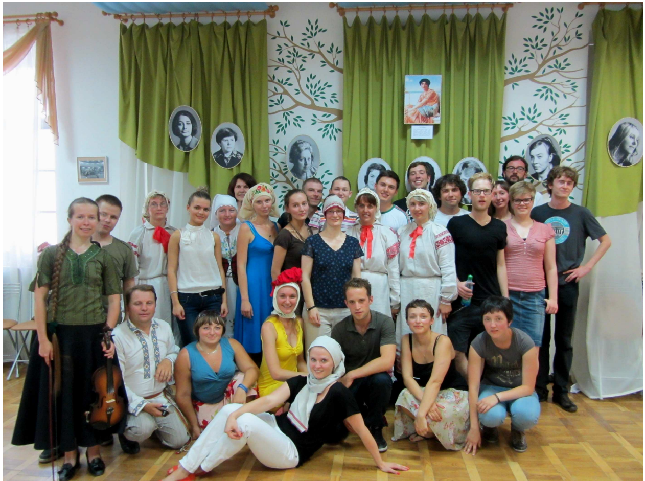
im Museum der Geschichte der belarussische Literatur – nach dem Ausprobieren belarussischer Volkstänze