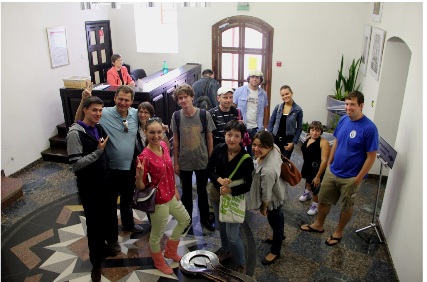
im Schloss Mir