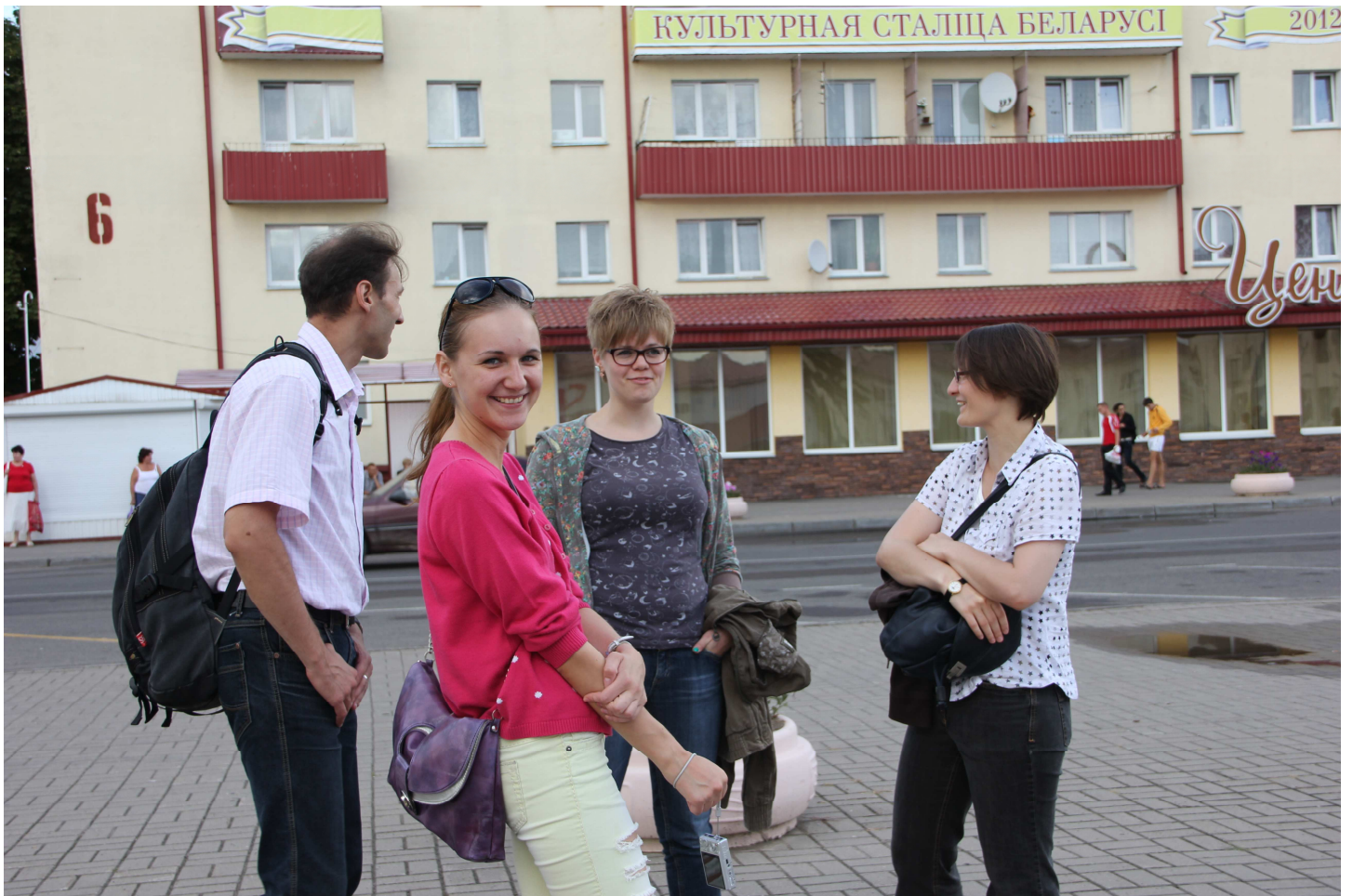
in Neswizh – der „Kulturhauptstadt von Belarus 2012“