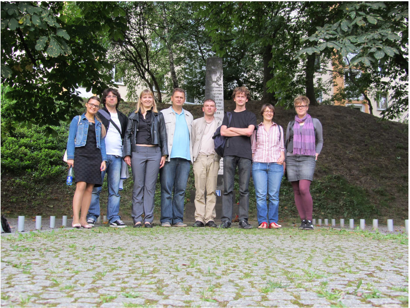
Gedenkstätte „Jama“ in Minsk