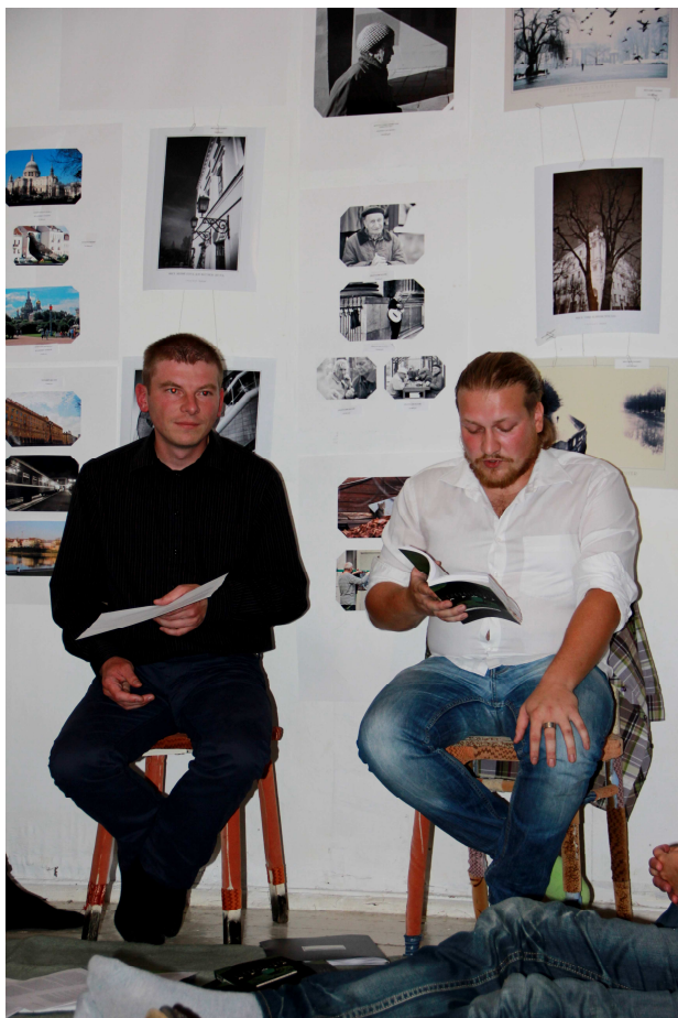
Lesung einiger ins Deutsche übersetzter Texte