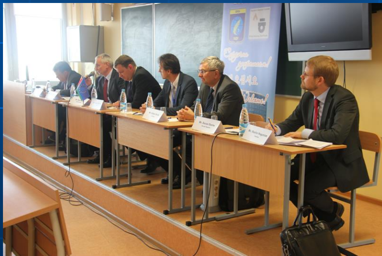
«Дипломатический десант» послов Европейского союза на ФМО