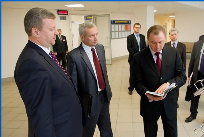
Встреча с министром иностранных дел Республики Беларусь В. В. Макеем