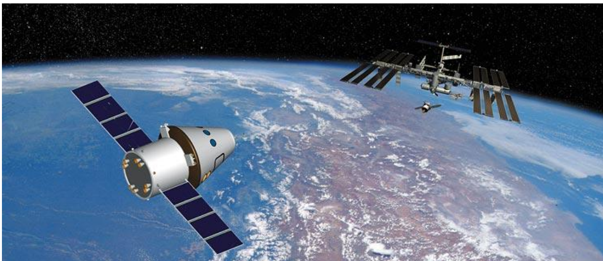
Дистанционное зондирование Земли из космоса

получать снимки в синей, зеленой, красной и инфракрасной зонах спектра. У первой системы разрешение на местности будет составлять 2 метра, у второй — 10. Космические снимки, выполненные панхроматической аппаратурой, можно использовать для составления геологических карт масштаба 1:25 000 — 50 000, а мультиспектральной — для 200-тысячного масштаба. И та и другая информация нужна для проведения новой геологической съемки территории Беларуси, прежде всего при изучении покровных четвертичных образований и связанных с ними полезных ископаемых.